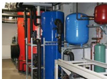
Durch die Wärmerückgewinnungstechnik wird ein 5000 Liter fassender Warmwasserspeicher für Brauchwasser erwärmt