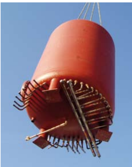
Der Warmwasserspeicher wird mit einem Kran in den Technikraum eingebracht

Das Fazit | Mit einer ausgeklügelten Kältetechnik wird in Lüdersdorf das Erfolgsrezept der Firma Lauenroth fortgeführt. Die Walter Roller GmbH sichert mit ihren Luftkühlern in Sonderanfertigung (die im übrigen nur in Deutschland hergestellt werden) die hohen Maßstäbe für die Produktionsqualität und die Firma Schnoor Kältetechnik hat mit ihrer kompetenten Ausführungen dafür gesorgt, dass alle Anlagen termingerecht eingebaut wurden und bislang ohne Störung arbeiten.