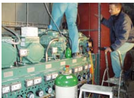
Im Technikraum wurden die Kälteverdichter sowie die komplette interne Elektroinstallation von der Firma Schnoor Kältetechnik installiert

dampfer „DHN 603 N flatline“ zweiseitig ausblasend, mit 5,2 kW eingesetzt. Die Raumgröße beider Räume beträgt ca. 200 m 2 , die vorgesehene Temperatur 0 °C.