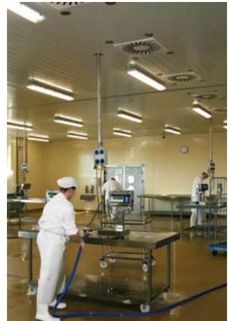
Der Produktionsraum wird mit zwei Roller „HVST 1011 EP“ gekühlt

läufe wurden hier aus Gründen der Betriebssicherheit getrennt.