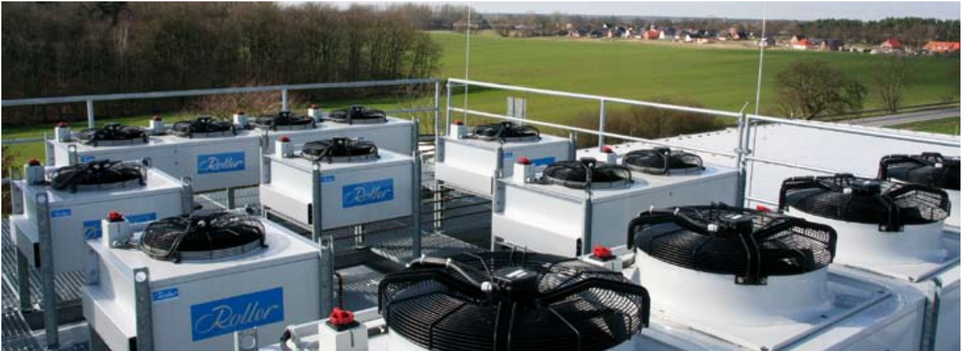
Die Firma Roller lieferte die Komponenten für die Kälte- und Klimatechnik

Tiefkühlager bei -25\text{ }^{\circ}\text{C} tiefgefroren“, berichtet Noock, als er mit schnellem Schritt durch die Tiefkühlagerhalle geht. Geradezu warm erscheinen dann die Lagerräume. Hier sind 0 bis 4\text{ }^{\circ}\text{C} normal und fast „tropisch“ wird es dann in der Produktionshalle: Hier herrschen bis zu 12\text{ }^{\circ}\text{C} . „Man muss sich hier schon bewegen, um warm zu bleiben“, antwortet Noock mit einem Schmunzeln auf die Frage der Kleidungsordnung, denn die hygienischen Überwürfe, die die Mitarbeiter tragen müssen, sind nur aus ganz dünnem Material.