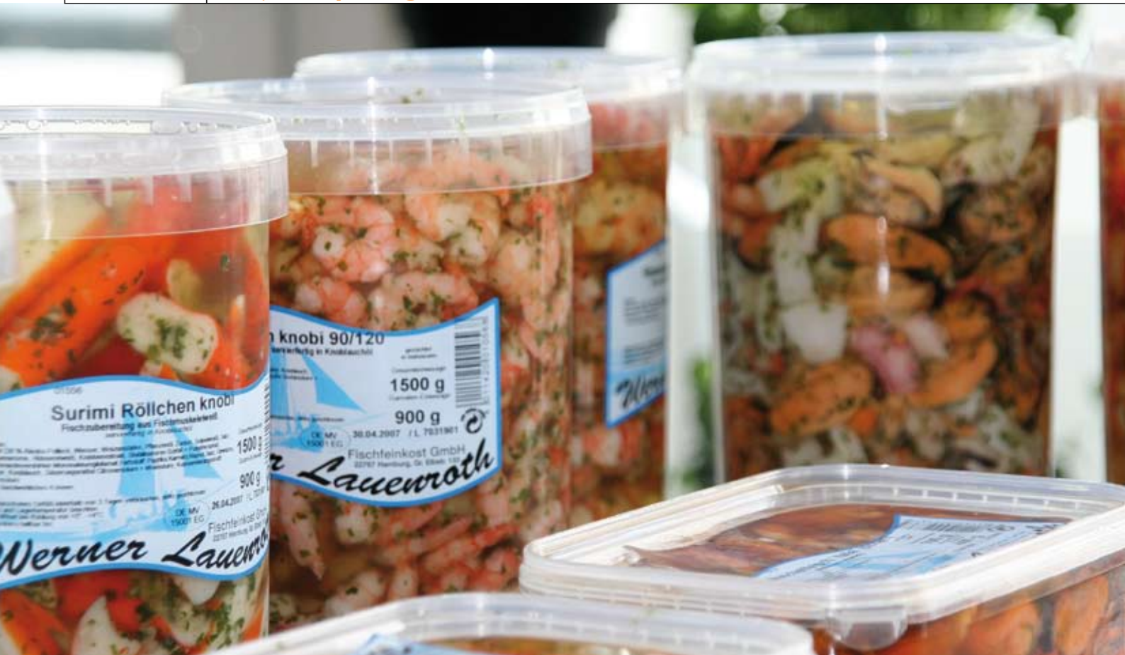
Meeresdelikatessen aller Art: Die Firma Lauenroth ist seit 1968 Hersteller von Fischfeinkost