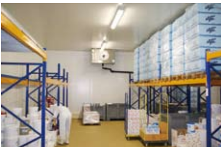
Die Lagerräume werden von zwei Hochleistungsverdampfern „HVST 1010 EP“ ...

ferrohre und die 2K-Lackierung runden dabei die Sonderausfertigung der Kälteanlagen des schwäbischen Herstellers ab. Bei allen Verdampfern ist der Lamellenabstand auf 10\text{ mm} festgelegt, um die Abtaufrequenzen möglichst niedrig zu halten und so Energie zu sparen. Die Abtauung geschieht durch eine elektrische Abtauheizung selbstoptimiert; das heißt, sie wird über die gemessene Temperaturdifferenz automatisch geregelt. Jeder Verdampfer hat dabei einen separaten Kühlstellenregler zur Optimierung der Abtau- und damit der Betriebskosten. Dabei