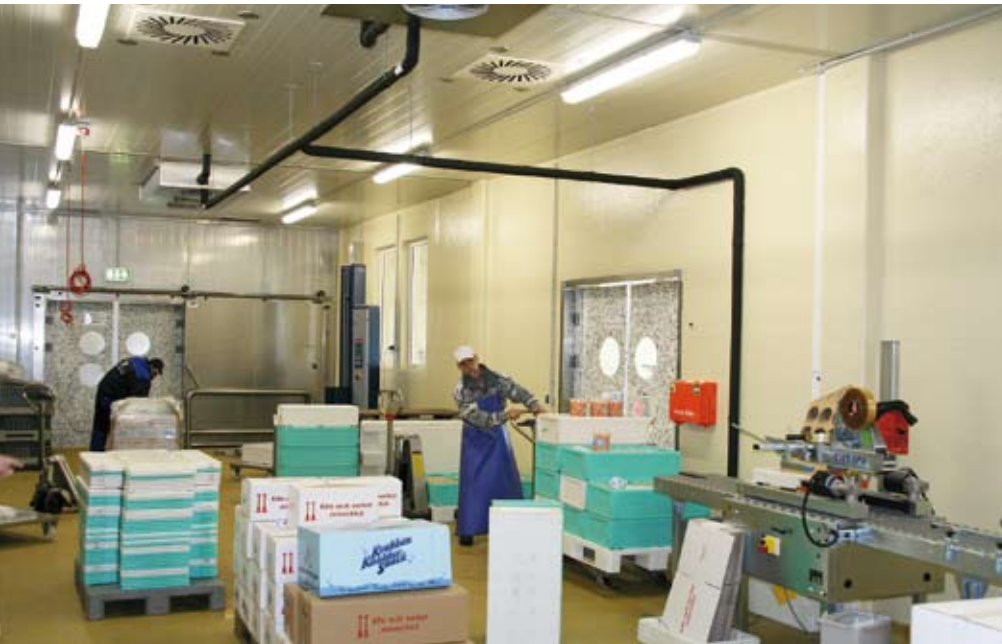
Im Packraum sorgen zwei Unterdeckenverdampfer „DHN 603 N flatline“ für die richtige Temperatur

kommt der „QKL-Regler“ von Coolexpert zum Einsatz. Der selbstoptimierende Regler mit autoadaptiver Abtauerkennung taut zum energetisch besten Zeitpunkt ab.