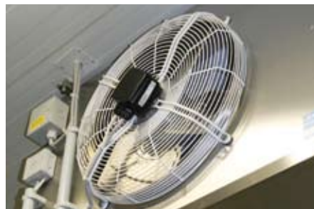
... auf 0\text{ }^{\circ}\text{C} heruntergekühlt

Aufwändige Kälte- und Klimatechnik | Der aufwändige Produktionsprozess wird im Hintergrund von einer ebenso aufwändigen Kälte- und Klimatechnik unterstützt. Insgesamt wurden 14 Luftkühler von der Walter Roller GmbH ( www.walterroller.de ) in den Produktions- und Lagerräumen montiert. Dazu kommen insgesamt sieben Verflüssiger auf dem Dach der Produktionshalle. Jeder klimatisierte Raum hat dabei seinen eigenen Kältemittelkreislauf mit eigenem Verdichter und Verflüssiger. Der