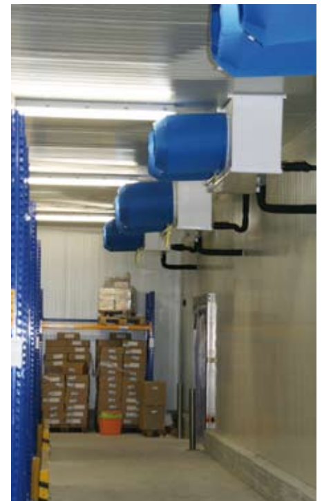
Im Tiefkühlraum 2 sind die Roller-Hochleistungsverdampfer vom Typ „HVST 1012 EP“ im Einsatz. Der „Shut Up“ verkürzt dabei die Abtauzeiten

Hygienebedingungen mussten eingehalten werden | Die Gehäuse aller Luftkühlergeräte wurden aus Edelstahl gefertigt, um den Hygienestandards der Firma Lauenroth zu genügen und gegen aggressive Reinigungsmittel geschützt zu sein. „Alle Lamellen sind mit einer speziellen Beschichtung gegen Korrosion versehen“, berichtet Rainer Ehrhard, Außendienstmitarbeiter der Firma Roller und ergänzt: „Um den Anforderungen zu genügen, mussten wir die Schutzart „D“ von Roller einsetzen“. Die verzinneten Kup-