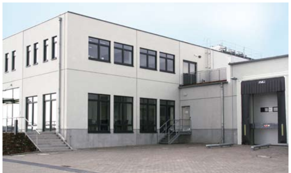
Die Planung und die Projektierung des Gebäudes und der Kälteanlage oblag dem Architekturbüro peter+jan gröpper und der Energieberatungsgesellschaft EB mbH aus Lübeck