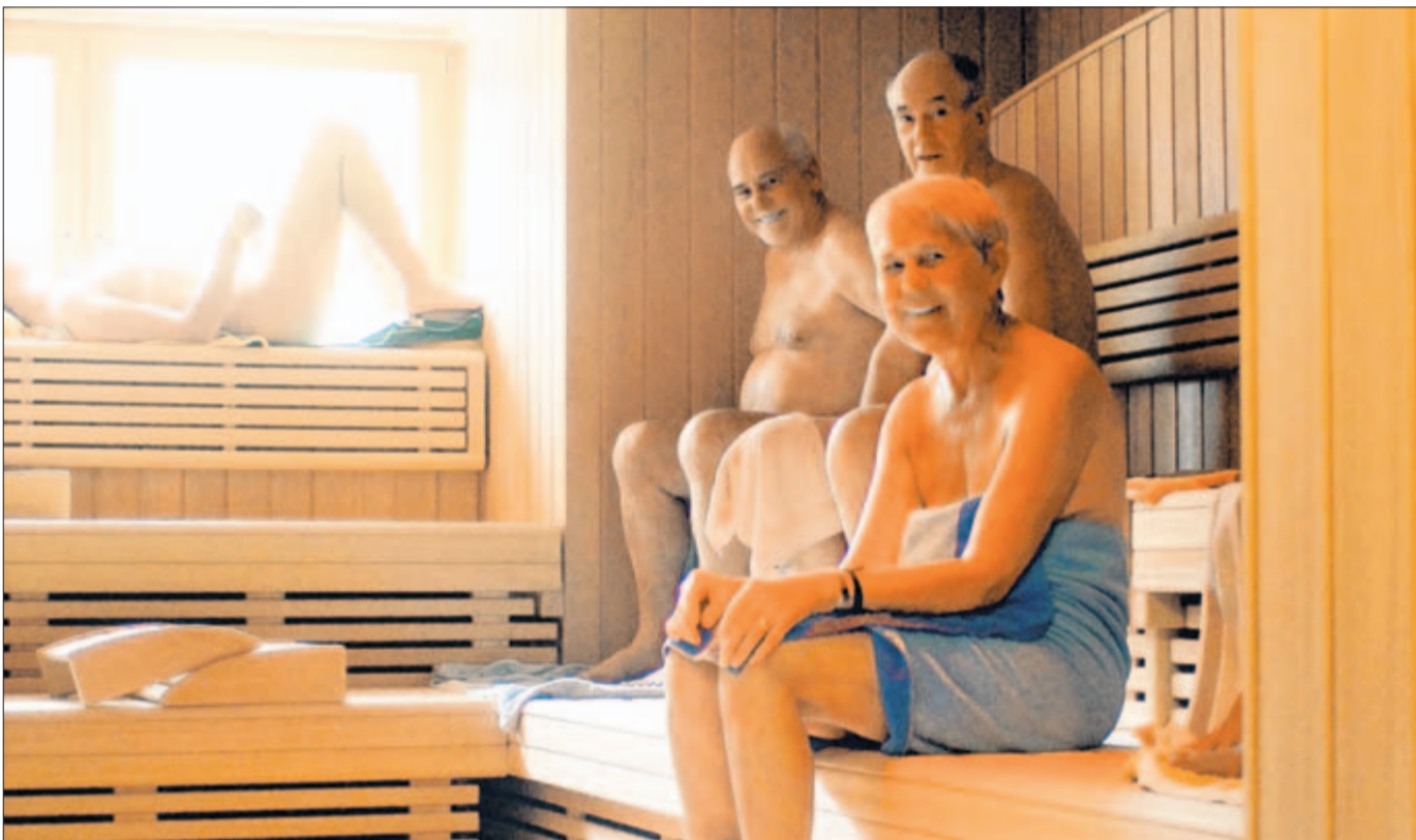
Ideal zum Entspannen: In der Saunalandschaft der Holstein Therme lassen Gäste die Seele baumeln.

Im Zentrum des neu gestalteten Bereiches ist das Tauchbecken zu sehen, hinter der Regalwand befinden sich die Erlebnisdusche und der Eisbrunnen, geradeaus die neuen Fußwärmbecken.