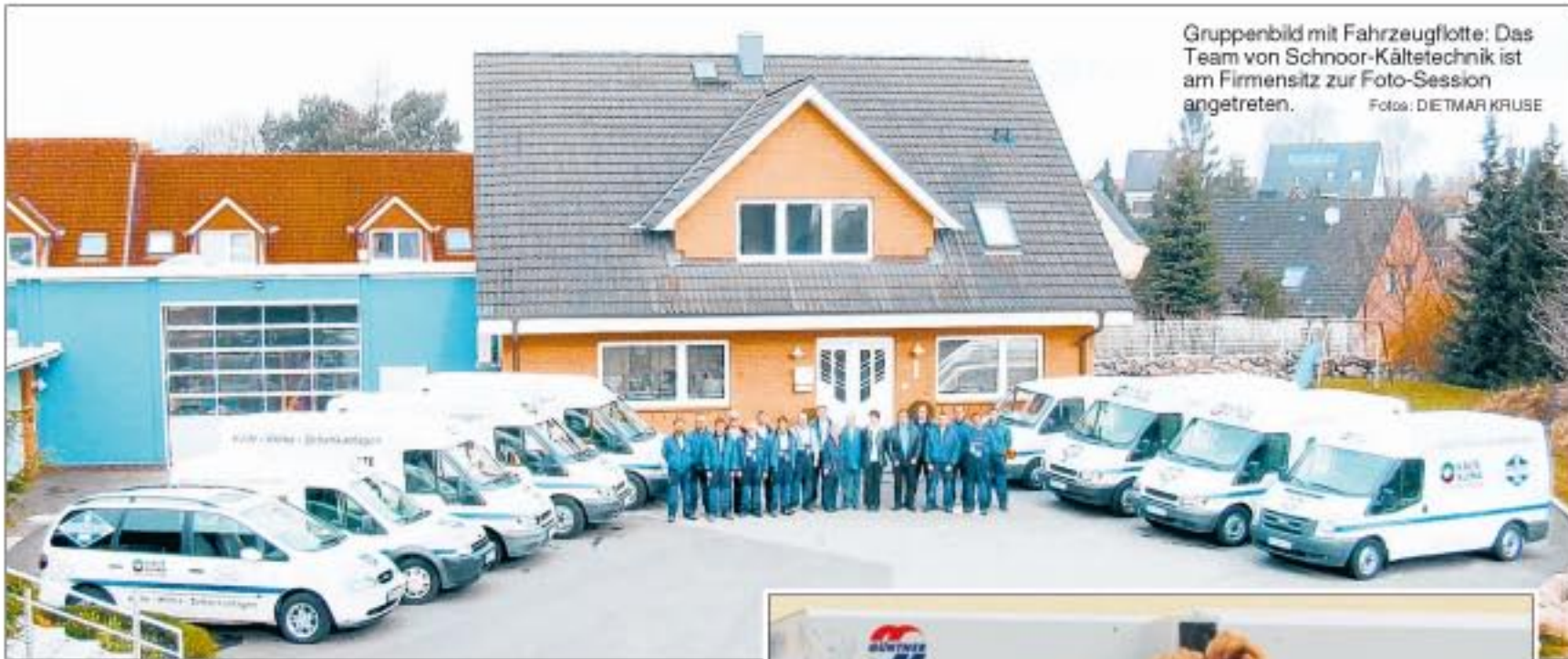
Gruppenbild mit Fahrzeugflotte: Das Team von Schnoor-Kältetechnik ist am Firmensitz zur Foto-Session angetreten.

Auf 40 Jahre Firmengeschichte kann die Schnoor Kältetechnik GmbH in Pansdorf seit März dieses Jahres mit Stolz zurückblicken. „Qualitätsanspruch mit Tradition“ lautet das Firmenmotto in Sachen Kälte, Klima und Schankanlagen.