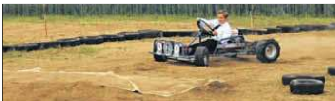
Kinder begeistern sich für die Go-Kart-Rennen.

Der Eintritt ist frei. Am Sonntagabend legt der DJ dann bis 23 Uhr auf, parallel dazu wird beim Königsschießen eine neue Majestät gesucht. aj