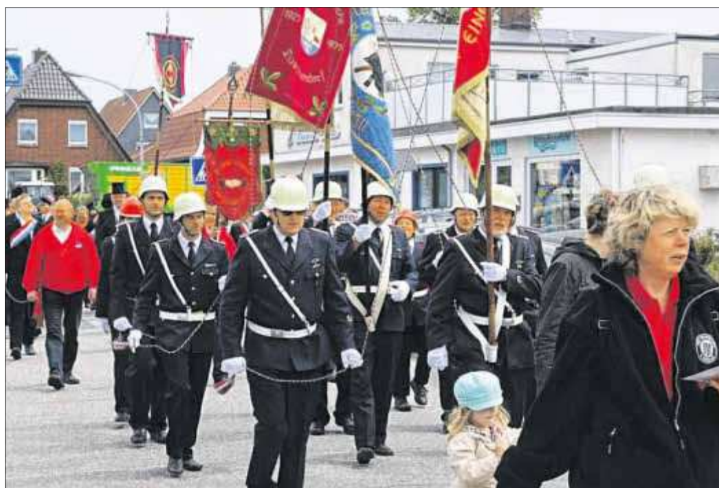
Traditionelle Fahnen werden auf dem Umzug des Dorf- und Handwerkerfestes durch das Dorf getragen.