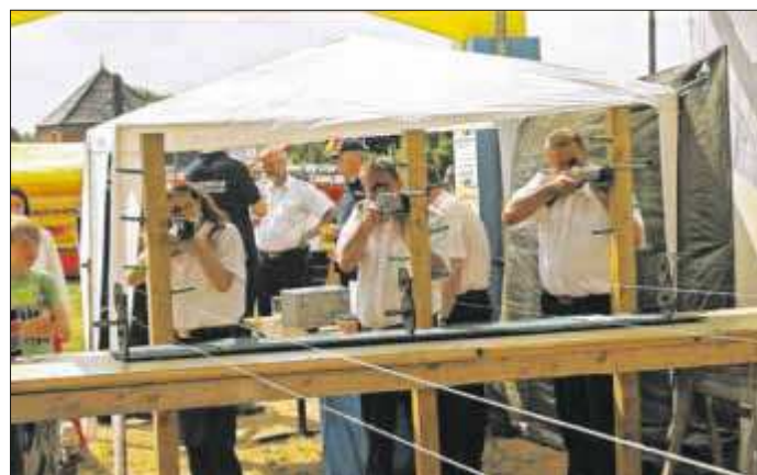
Betriebsschießen – im vergangenen Jahr legte unter anderem die freiwillige Feuerwehr Techau an.