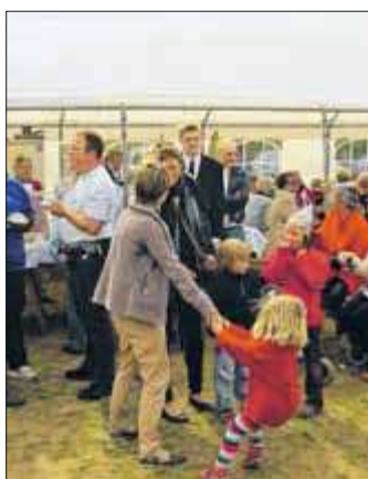
Der Kuchenstand ist wie immer ein Magnet.

19 Uhr: Ü30-Party im Festzelt mit DJ Henning Flink bis 1 Uhr, Eintritt frei.