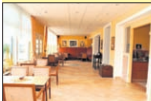
Rezeption, Aufenthalts- und Frühstückszimmer sind jetzt ein Raum geworden. In der neuen Thien's Café-Bar haben 45 Gäste Platz.