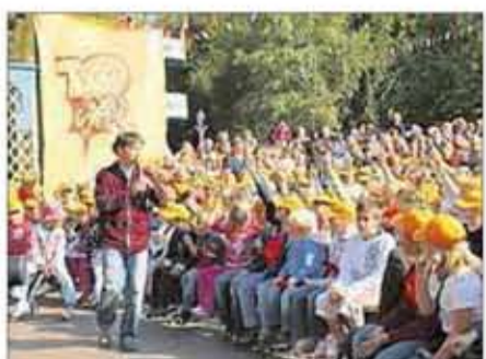
Der TOGGO-Spaßtag findet in diesem Jahr am 19. September mit den Stars von SuperRTL im HANSA-PARK statt.

Benachbart zur Westernstadt „Bonanza City“ befindet sich ein wildro-