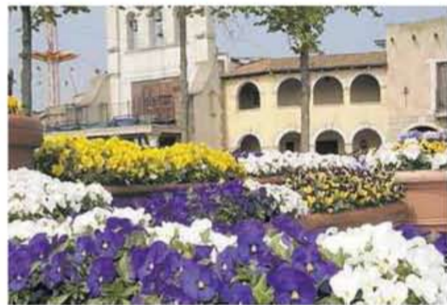
Tausende von bunten Frühlingsblüchern stehen Spalier, wenn der HANSA-PARK wieder zum Osterfest einlädt. Mit vielen Aktionen für groß und klein ist für jede Menge Abwechslung gesorgt.